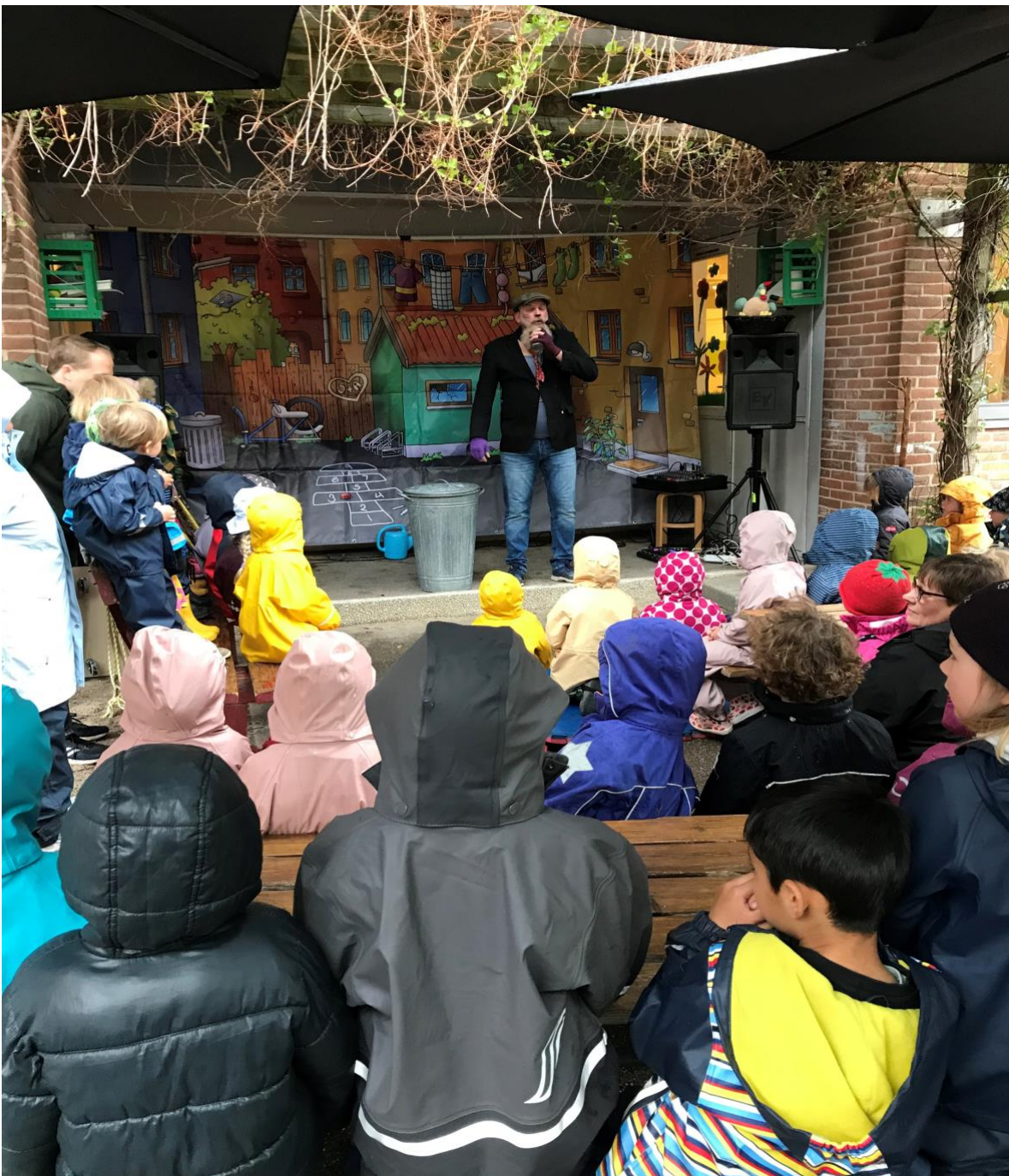
"Skrot og Tuti og den magiske skraldespand" på besøg i Dansk Tysk Børnehus april 2021

fokus på forskelligheder og samarbejde er nøgleord. Vi inddrager forældrene gennem dokumentation og information, samt gennem konkrete opgaver. Vi inddrager lokalmiljøet ved at benytte forskellige faciliteter og muligheder i området, samt gennem samarbejde med forskellige lokale instanser. Gennem kultur, æstetik og fællesskab understøttes både barnets alsidige personlige, samt sociale udvikling. Barnet udvikler krop og sanser gennem kropslige og sansemotoriske aktiviteter samt bevægelseslege. Barnets kommunikative og sproglige kompetencer udvikles bl.a. gennem dialog, sang, musik, kreativitet og bevægelse. Ved at have fokus på kultur, æstetik og fællesskab i udelivet, understøttes barnets forståelse af natur, udeliv og science.